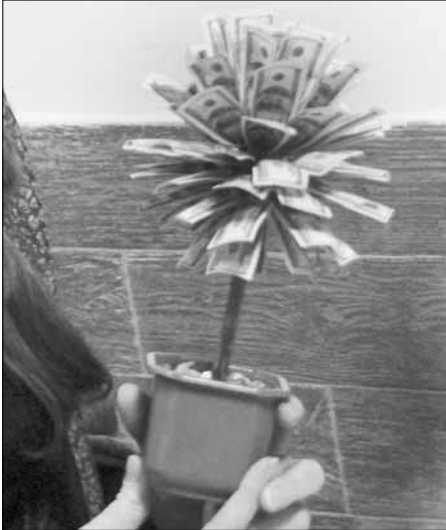
Документов остается одинаковым веде: рассказать о своих заработках.

Вопрос правды заходим еще на один сайт — администрации Мянса. Подключая мундальную казенную учреждение