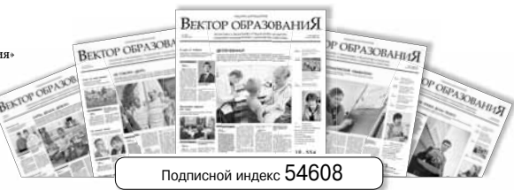
Подписной индекс 54608

Но тут же осекаем у «соседи» по списку — тоже, кстати, из детсадовского — годовой доход составляет 1,5 млн рублей (могу уверенно высчитать: что-то около 125 тысяч в месяц). Немного хочется посмотреть на образцово-показательный, наверное, детский сад.