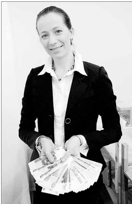
За высокими зарплатами скрывается повышенная нагрузка, суммарно превышающая ставку в 18 часов

Делу время, а по ставке — час. Современное законодательство поставило учителя как минимум в двойственное, парадоксальное положение. С одной стороны, есть Трудовой кодекс, а с другой — единственное зеркало нагрузки учителя, выраженное в почасовой учебной нагрузке, которая для учителя составляет 18 часов в неделю. >> 2