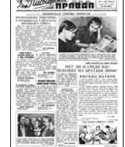
деятельность детских организаций в других странах.

Последний и, пожалуй, самый весомый аргумент в пользу соблюдения высокой Божьей заповеди: «Не укради». Там и хочется добавить: «Иначе тебя уволят».